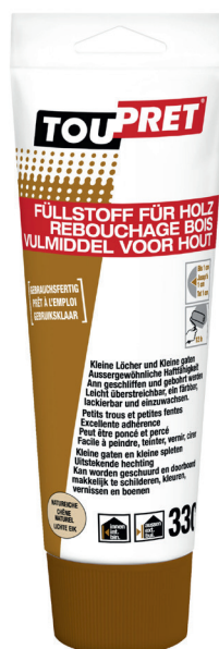
TUBE : 330 g